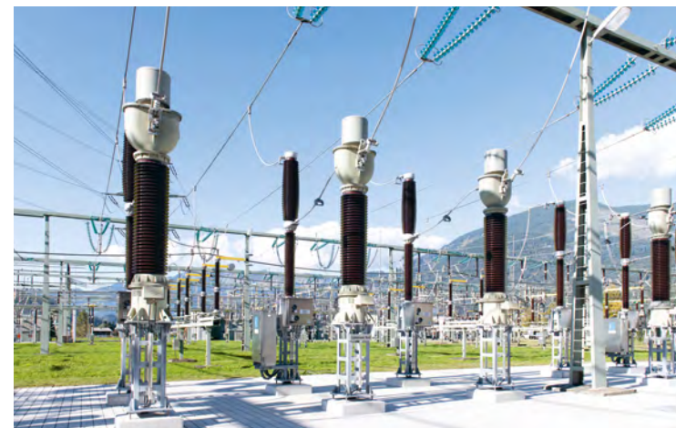
Das Krafthaus wird unweit des Umspannwerks Bürs errichtet.