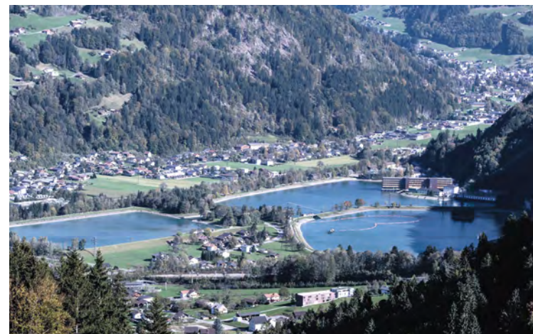
Die bereits vorhandene Infrastruktur wird optimal genutzt. Dazu zählen unter anderem die Becken in Rodund.