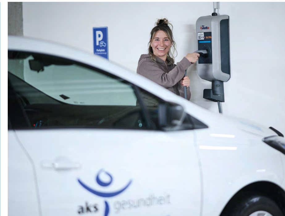
Die E-Autos der aks Gesundheit nutzen die Ladelösungen von vkw vlotte.